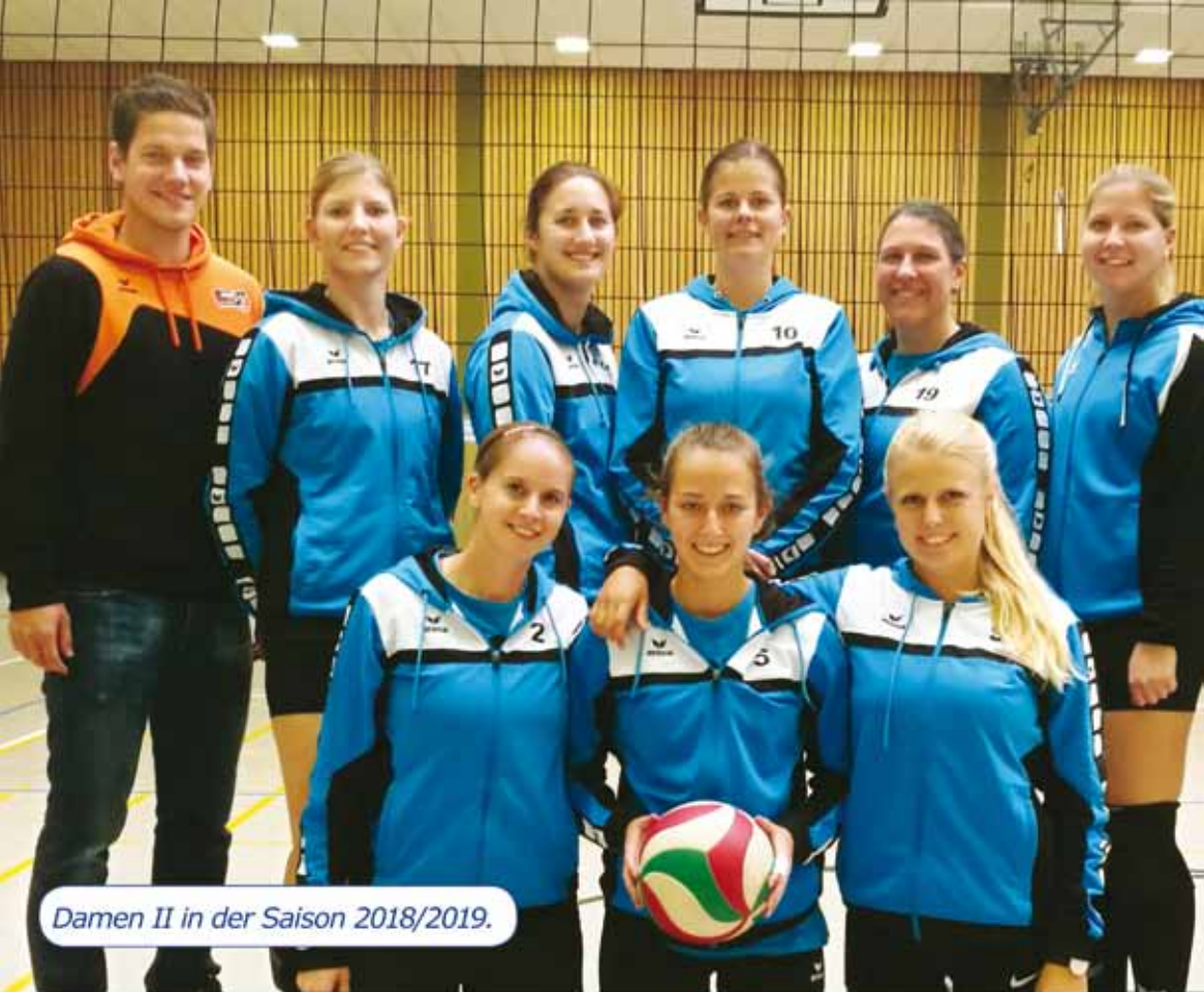
Damen II in der Saison 2018/2019.