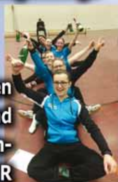
Korbballerinnen sind Mittelrhein- MEISTER