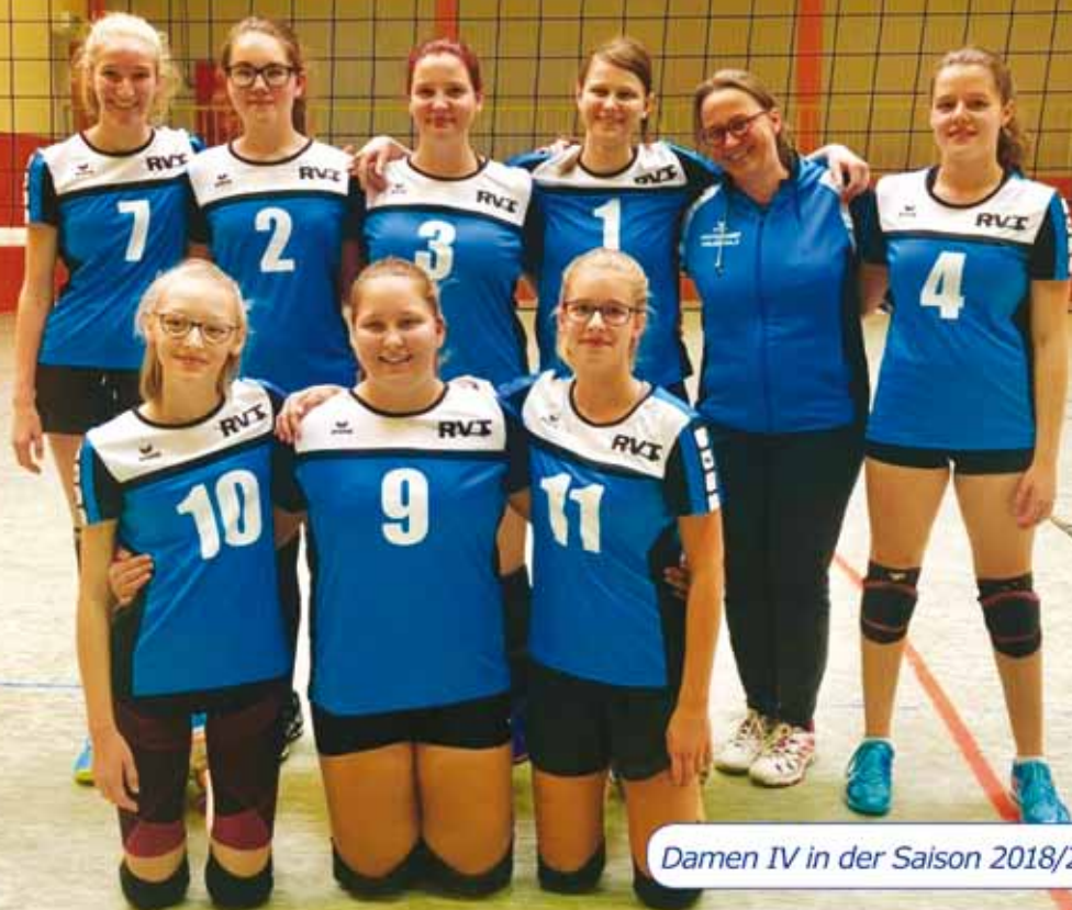
Damen IV in der Saison 2018/2019.

zunehmend erkennbar und am letzten Spieltag gelang ein phasenweise deutliches 3:0 gegen den nun Drittplatzierten TSV Emmelshausen, auf den man am Ende 11 Punkte Vorsprung herausgearbeitet hatte.