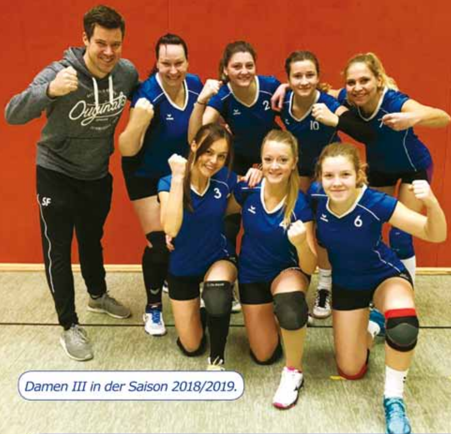
Damen III in der Saison 2018/2019.