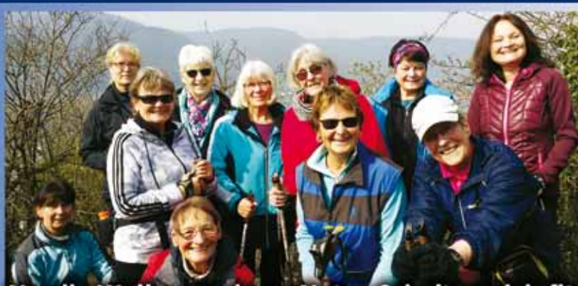
Nordic Walker erobern Natur & halten sich fit