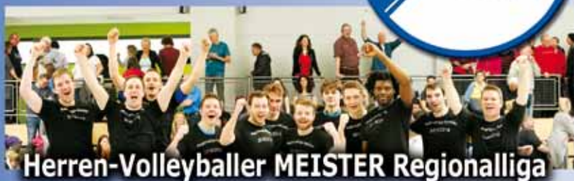
Herren-Volleyballer MEISTER Regionalliga