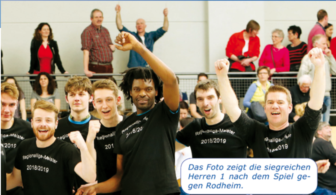
Das Foto zeigt die siegreichen Herren 1 nach dem Spiel gegen Rodheim.