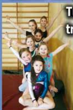
Turnerinnen trumpfen auf