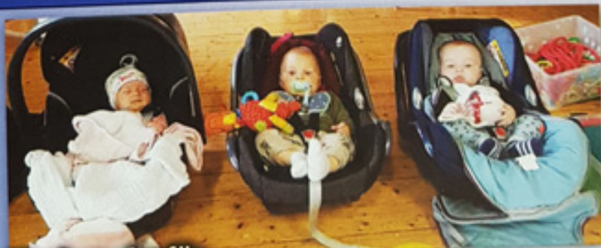
Nachwuchs für TVF-TurnZWERGE & TurnKNIRPSE