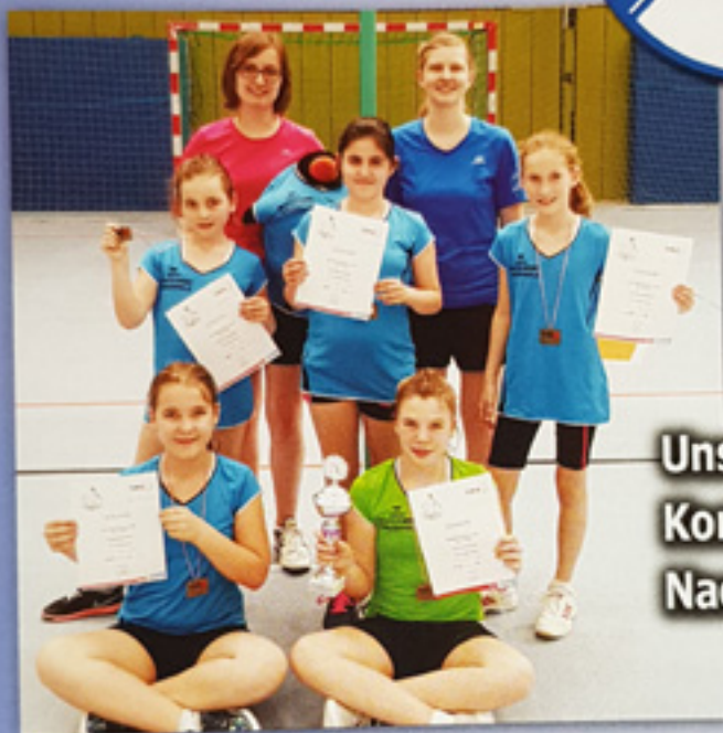
Unser Korbball- Nachwuchs