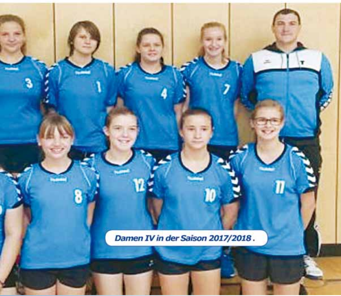
Damen IV in der Saison 2017/2018.

Dies zeigt für Storm das Potential der Mannschaft und er glaubt fest daran, dass man in Zukunft noch mehr tolle Berichte von dieser Mannschaft hören wird.