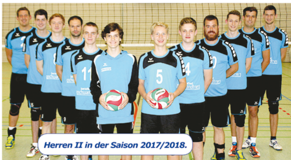
Herren II in der Saison 2017/2018.

sich die Spieler am Ende gut zusammengerauft und konnten ab Mitte Februar noch drei wichtige Spiele gewinnen, darunter zwei gegen die direkten Tabellennachbarn aus Mainz-Bretzenheim und Konz. So beendet die SG die Saison 2017/2018 auf dem sicheren Tabellenplatz 6 der RLP-Liga und steigt optimistisch in die Planung für die neue Saison ein.