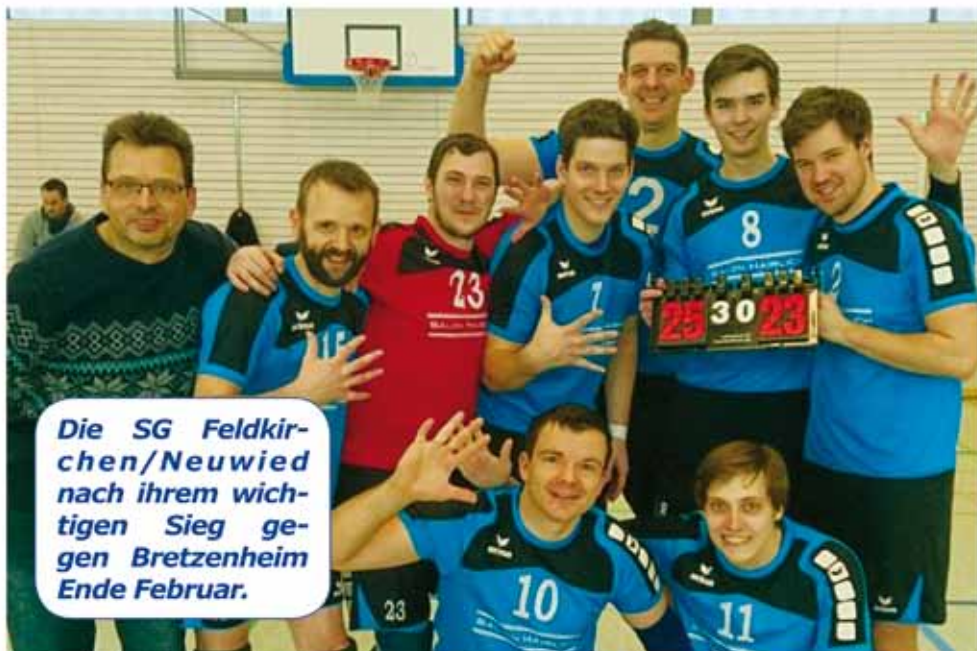
Die SG Feldkirchen/Neuwied nach ihrem wichtigen Sieg gegen Bretzenheim Ende Februar.

So verwundert es kaum, dass die Mannschaft den Großteil der Saison eher auf den hinteren Tabellenplätzen verbrachte, sich aber nach Kräften gegen einen drohenden Abstieg wehrte. Und so haben