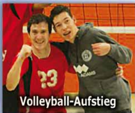
Volleyball-Aufstieg Landesliga Herren II