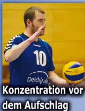
Konzentration vor dem Aufschlag